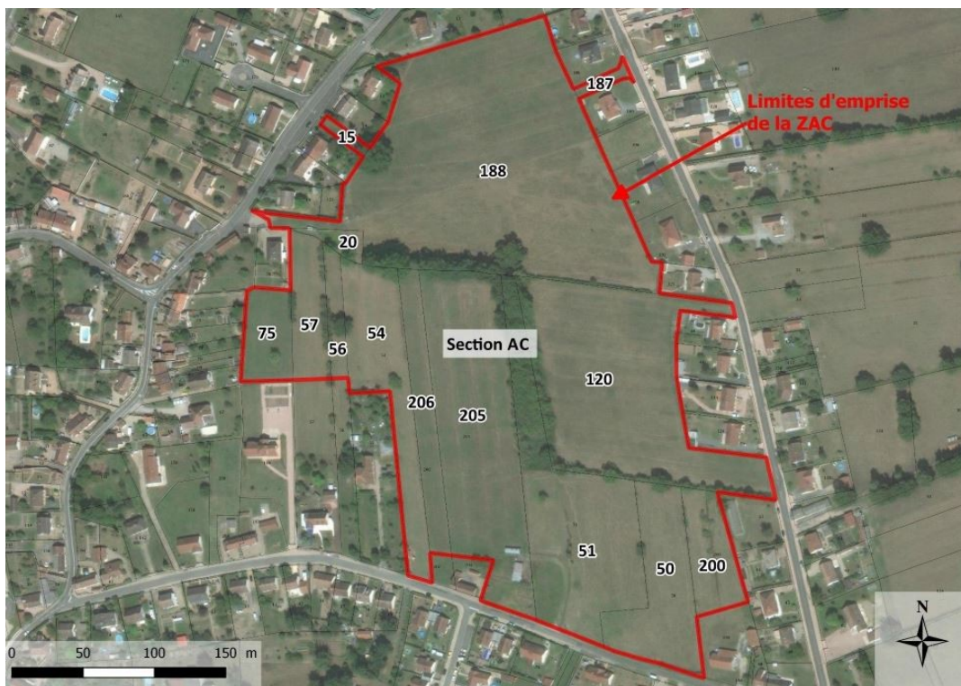
Emprise de la ZAC

Il consiste en une zone d'aménagement concerté (ZAC) d'une surface de 9,1 ha dédiée à la création de logements. Le site d'implantation est constitué de milieux prairiaux comportant quelques haies et arbres isolés, enclavés au cœur d'un îlot cadastral, dans un secteur proche du bourg et urbanisé sur son pourtour.